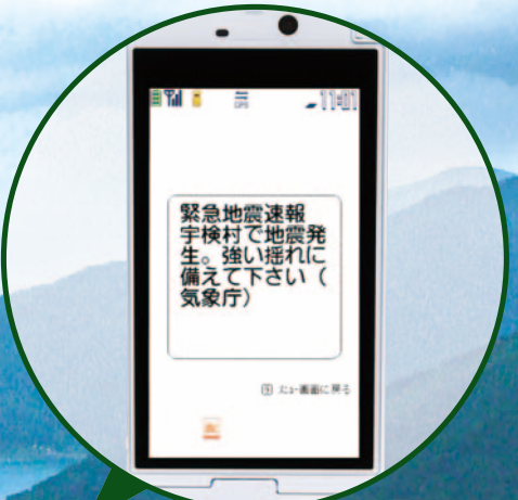
▲エリアメールが届くと、専用の着信音とハイブレーションでお知らせ。画面には、送られたメールがポップアップして配信内容を自動表示する。