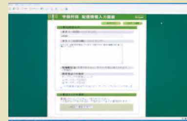
▲エリアメールの管理画面。緊急の際、この画面にメッセージを入力して、エリアメールセンタへ送信する。

こうして2008年9月、地方自治体として西日本初、全国でも3番目に、同村へエリアメールが導入された。これに際して同村では、エリアメールを用いた避難訓練も実施した。訓練で陣頭指揮をとった宇検村村長 國場和範氏は「文字情報なので聞き漏らしもなく、これならば従来の手段を補完できます」と語る。すでに同村のエリアメールは、周辺自治体にも注目されており、問い合わせや視察が相次いでいるという。また、宇検村以降、沖縄県那覇市などでも導入を決めており、今後エリアメールを採用する地方自治体が少しずつ増えそうだ。