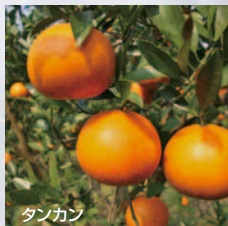
宇検村の豊かな自然