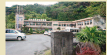
鹿児島県 宇検村 ■役場所在地 鹿児島県大島郡宇検村湯湾915 ■URL http://www.uken.net/